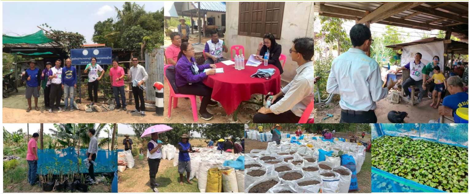
18 เมษายน 2566 สถาบันวิจัยและพัฒนา มหาวิทยาลัยราชภัฏสุรินทร์ โดยคณะกรรมการลงพื้นที่กำกับ ติดตามและประเมินผลโครงการยกระดับคุณค่าและมูลค่าผลิตภัณฑ์ชุมชนด้วยนวัตกรรมและเทคโนโลยีตามโมเดลเศรษฐกิจ BCG สู่การพัฒนาที่ยั่งยืน ณ บ้านทุ่งโก หมู่ 2 ต.หนองเมธี อ.ท่าตูม จ.สุรินทร์