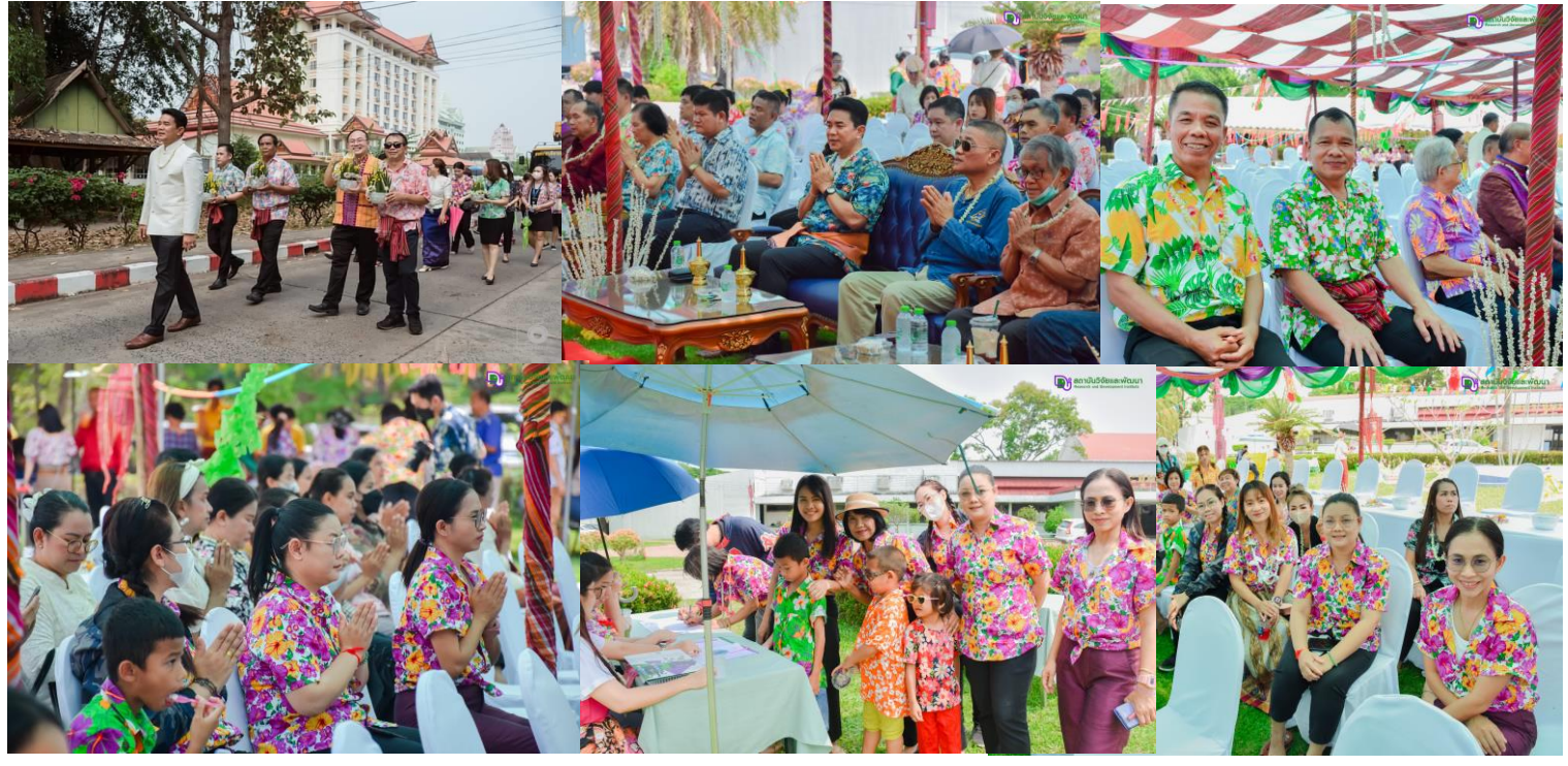
11 เมษายน 2566 เวลา 08.30 น. ผู้บริหาร และบุคลากร สถาบันวิจัยและพัฒนา เข้าร่วมสืบสานวัฒนธรรมประเพณีสงกรานต์ มหาวิทยาลัยราชภัฏสุรินทร์ประจำปี 2566 ณ หอประชุมมหาวิทยาลัยราชภัฏสุรินทร์